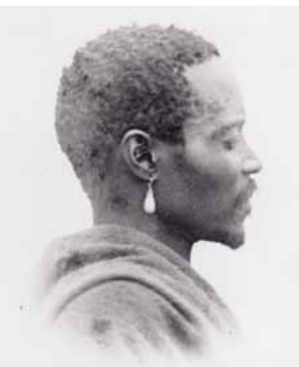
Abb. 8: Zazini. Gustav Fritsch 1863 (Besitz der National Library, Cape Town, Südafrika)

Fotografien repräsentieren Menschen in einer ganz bestimmten Weise, sie haben sowohl in Europa als auch in Afrika in der kolonialen Situation visuelle Erinnerungskulturen beeinflusst und neue visuelle Referenzsysteme geschaffen. Die heutigen kritischen und ästhetischen Interventionen afrikanischer Fotografen und Fotografinnen verändern in zweierlei Weise die kolonialen Bilder: Einmal können die Bilder anders eingeordnet und anders interpretiert werden; die Handlungsträgerschaft verschiebt sich von den kolonialen Fotografen zu den Abgebildeten. Zweitens kann das Archiv gleichsam umsortiert werden, wenn Maqoma heute als Titelbild von Kronos in Erinnerung bleibt und nicht als Exempel für Gustav Fritsch' ›Eingeborenen‹, oder wenn Santu Mofokeng im Projekt ›The Black Photo Album, 1890–1950‹ mit den alten Studiofotografien afrikanischer Familien arbeitet. 44 Die oft recht steif anmutenden Aufnahmen von Familien, Paaren, Freunden und Babys mögen harmlos wirken, besitzen jedoch in der spezifischen südafrikanischen Situation, in der als schwarz klassifizierten Menschen jede Dignität und auch Urbanität konsequent verweigert worden ist, eine politische und ästhetische Sprengkraft.