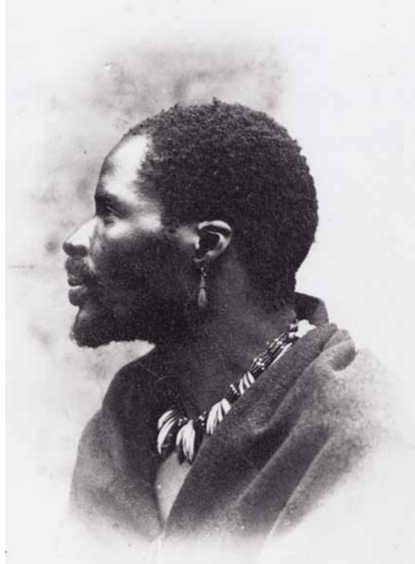
Abb. 6: Somi. Gustav Fritsch 1863