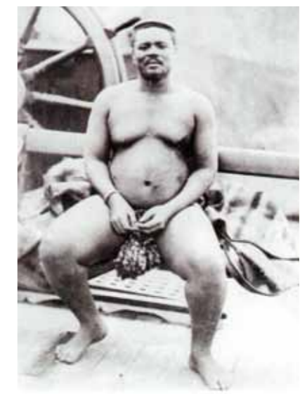
Abb. 7: König Cetshwayo an Bord der HMS Natal.

Eine Fotografie, die in den verschiedenen Kolonialgebieten zirkulierte, ist die Abbildung von König Cetshwayo. Auf seinem Weg ins Exil nach Kapstadt wurde der abgesetzte König 1879 auf dem Schiffsdeck der Natal mehrfach portraitiert und innerhalb nur weniger Monate zeigten schottische Missionare bei der Vorführung mit einer Laterna magica im fernen Malawi ein Foto von ihm als Warnung vor Aufstandsgelüsten. 41 Es bleibt im Dunkeln, was die versammelten Zuschauer bei der Projektion der Fotografie sehen sollten. Ein Missionar schrieb: »We impressed upon them the necessity taking some steps in the way of improvement.« 42 Das Bild aber sagt im Grunde nichts anderes als »dies ist der abge-