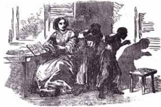
Abb. 2: Scene from the section on Natal and Zululand: black children washed, dressed, fed and confronted with the alphabet

Es beginnt mit einer angstvollen Abwendung von dem Buch, das Bibel und ABC zugleich repräsentiert, dem Licht des Christentums und der Zivilisation. Obwohl die äußeren Zeichen der Bekehrung in Form westlicher Kleidung schon vorhanden sind, muss nun erst noch die innere Überzeugung gegen den Widerstand des Heidentums folgen, wie diese Illustration aus einer Missionszeitschrift vermittelt.