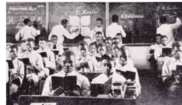
Abb. 4: Tigerkloof, Ausbildungsstätte der London Missionary Society, ursprünglich als Moffat Institute in Kuruma gegründet. 1905 als Tigerkloof südlich von Vryburg neu eröffnet

Das dritte Beispiel zeigt die bereits geordnete Schule im geschlossenen Raum, und hier wird die Ordnung der Schrift auch in der Sitzordnung, den geraden Linien auf der Tafel und dem routinierten Studium der Bücher durch die Schüler widergespiegelt.